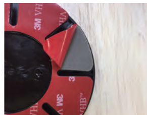
②赤い面を剥がします