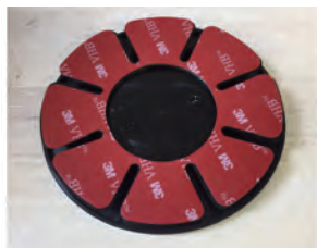
①同梱の両面シールを台座側に貼ります