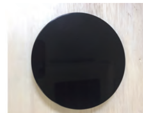
③ダッシュボード等に貼り付けます

* 貼り直しをすると吸着力が落ちます。設置場所をよく考え場所を選んでから貼り付けてください。貼り直しなどで吸着力が落ちた場合は市販の強力両面テープを代用してください。